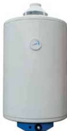
AGC 100 litres / 6 kW