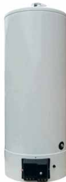
AGC 150 à 400 litres / 7 à 27 kW