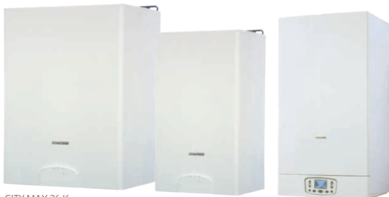
CITY MAX 26 K